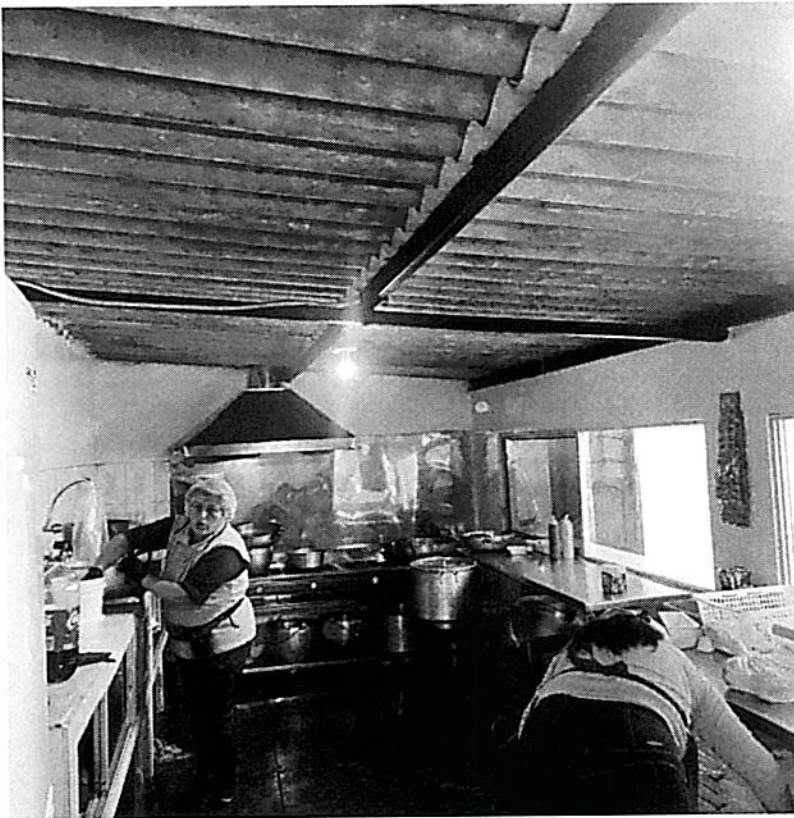
d. Módulo de cocina/bar que requiere remodelación (vista interior)