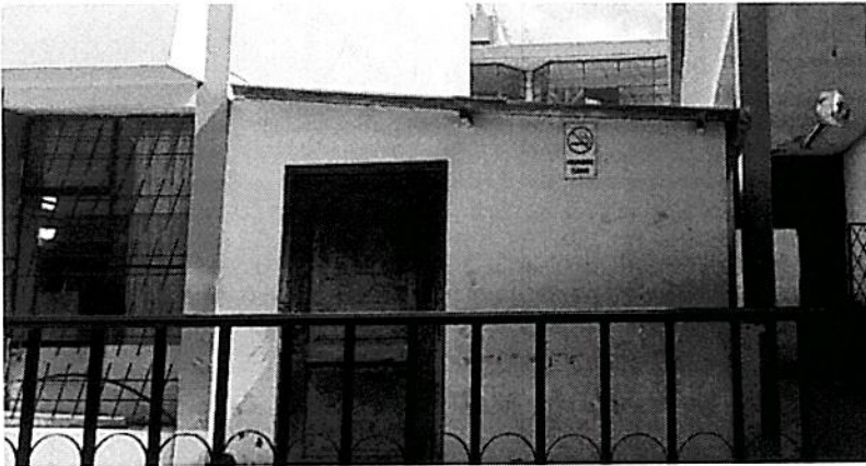
c. Módulo de cocina/bar que requiere remodelación (vista exterior)