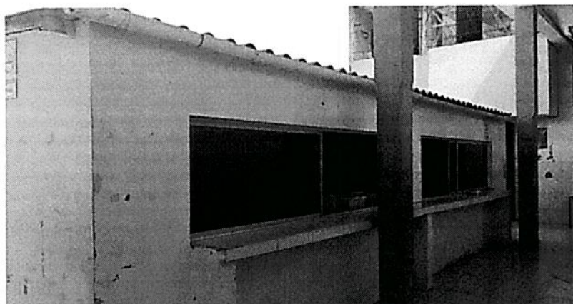
b. Módulo de cocina/bar que requiere remodelación (vista exterior)