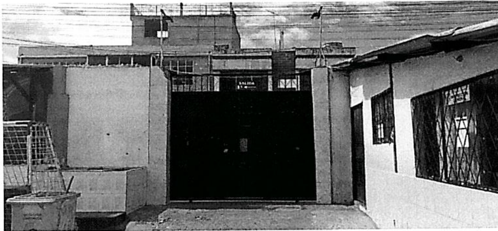
f. Ingreso principal que se solicita readecuación y construcción de garita de guardia.

Una vez constatado el estado actual de la infraestructura y registrado el estado actual de las mismas se ha realizado una breve cuantificación determinando lo siguiente: