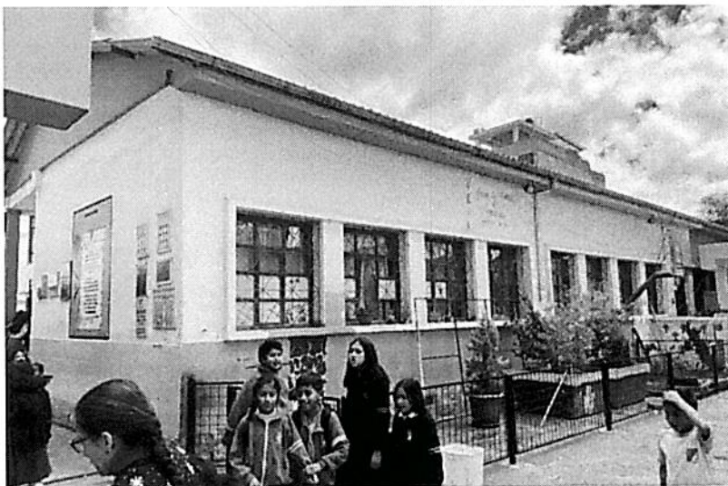
a. Módulo de aulas que se solicita el derrocamiento y construcción nueva.

Se procedió al registro fotográfico del estado actual de la infraestructura el cual se presenta a continuación: